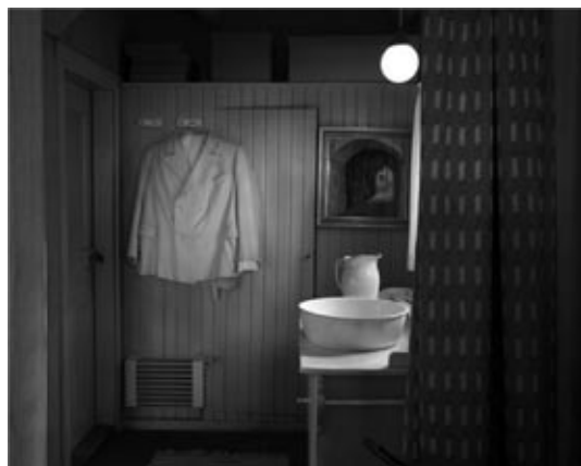
Sibelijusovo letnje odelo

Kuću je, u „nordijskom romantičarskom“ stilu, projektovao (bez ikakve naknade) prijatelj arhitekta, Lars Sonk. U suštini, u pitanju je velika brvnara od balvana podignuta na čvrstoj