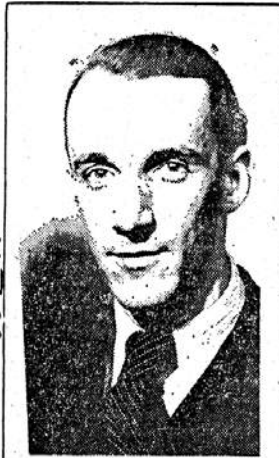
МАРКО РИСТИЋ (снимак из тридесетих година)