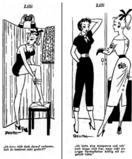
„Ich kann mich doch darauf verlassen, daß du bestmal nicht guckst?“

Naučnici sa univerziteta Harvard u Bostonu su istraživali i popularne akcione igračke kojima se igraju dečaci, kao što su to, na primer, likovi iz filma Star Wars ili GI Joe . Figura GI Joe iz 1960. godine ima bicepse čiji obim bi bio 30 cm, što bi odgovaralo proporcijama prosečnog muškarca. Ali model iz 1997. godine ima bicepse čiji obim je 65 cm. Psiholozi