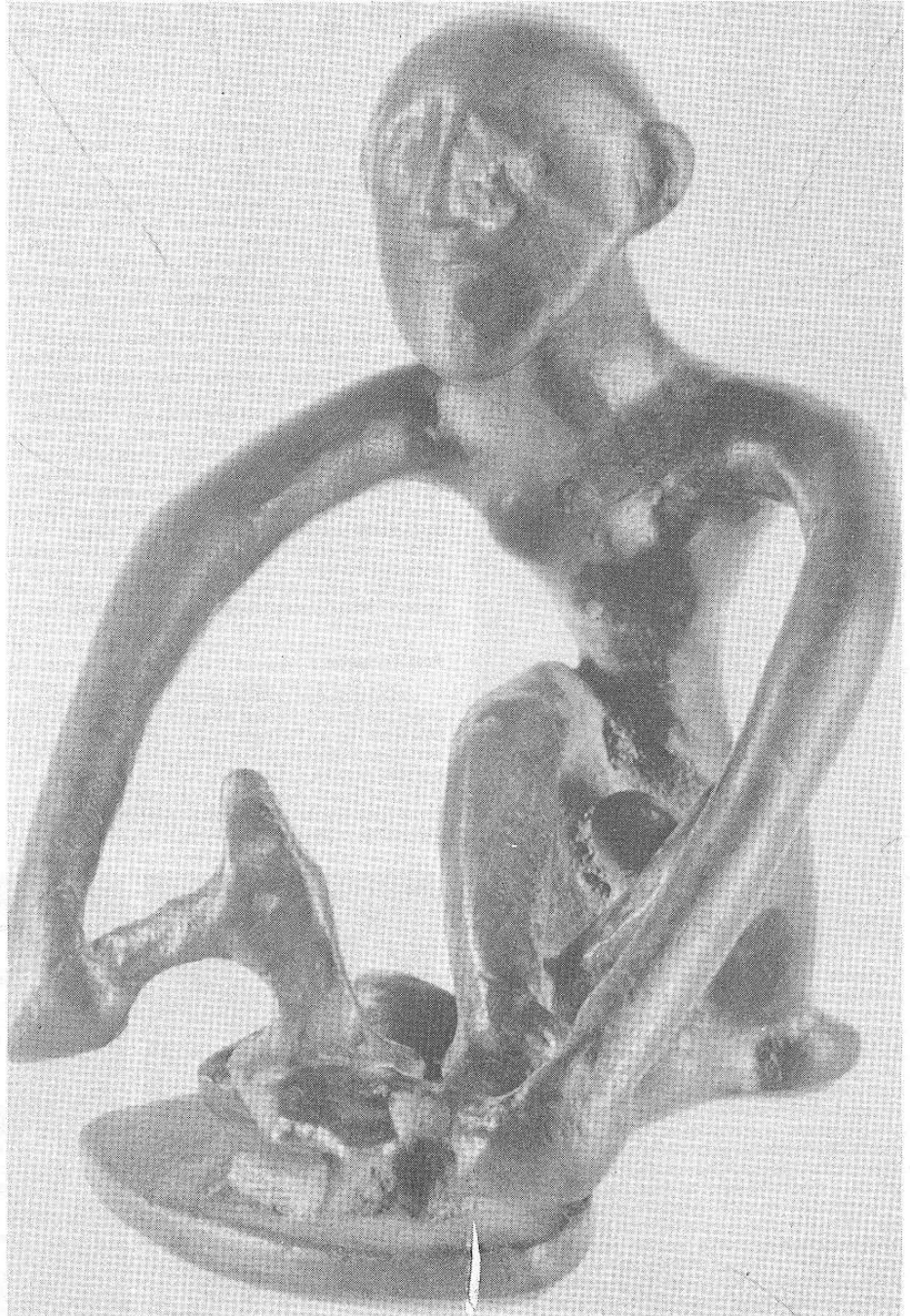
Kovač, bronzana statueta vranište (bela palanka) VIII – VII vek pre naše ere visina 8 cm.

Dalje, na izložbi je zastupljena antička grčka i rimska umetnost. Grčka, koja je delom neposredno stizala u naše krajeve, a delom preko različitih uticaja i kopija iz kasnijih vremena, i rimska, ona koja je najvećim delom nastala na ovom tlu, pre svega, u tadašnjim centrima Viminaciumu, Naisusu, Stobima i Singidunumu. Izložene su tu i arhajaska Portretna zlatna maska iz 6. veka pre n.e. bronzani krater nađen u Trebeništvu, amforei krateri, Orinohe, helenistička kopija Atine Partenos, Satir od bronzne s početka 1. veka, portret Klaudija Livia iz 1. veka n.e, mramorna glava devojke s početka 2. veka n.e, kameja od sardoniksa i bronzani portreti Konstantina Velikog i carice Eufemie. Tu je i nekoliko predmeta koji, više vremenski nego po simbolima, pripadaju vremenu radnog hrišćanstva. I