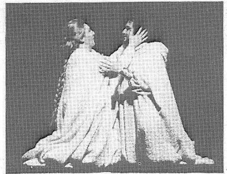
scena iz opere »Lombardijci«