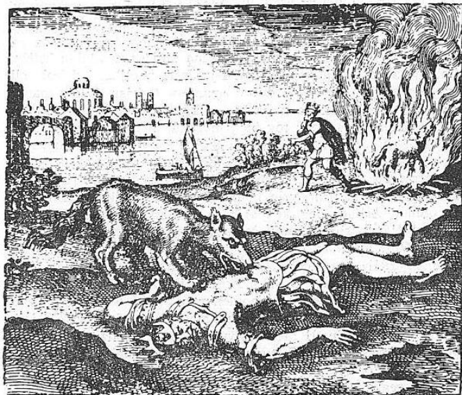
»kao alhemični »kralj«, predani smo njegovom proždiranju — istovremeno, on tamo, sam izgara, da bi oslobodio »kralja« (esenciju) iz utrobe«.

Posmatajući mnoge sugestivne figuracije u vezi s mumijama, interesantno je zapaziti da se ovde srećemo, kao i često u EGIPTU, s nečim naizgled apsurdnim. Treba znači »naoštriti uši« (podsetimo se da je SET, kao karakteristikom, označen PODSEĆENIM »tupim« ušima!); ovde kao da srećemo nešto slično, namernom izboru GEOCENTRIČNOG prikaza heliocentrizma. Egipat podiže hramove u slavu tog kosmičkog ČOVEKA, čiji lik utelovljava svaki apstraktni princip. Organizam ČOVEKA osvetljen je kao sinteza kosmičkih harmoničnih inter-relacija, kao mreža milii utelovljenih u organe, pod vlašću svemoćnih »boginja« žlezda, povezanih krvlju, nervima, tokom električne (dvokrake) vatre, održan kostima, tkivima mesa i kože — koji ga ograničavaju u mištično »polje« ili kvadrat (temenos) alhemije! U toj živoj srži