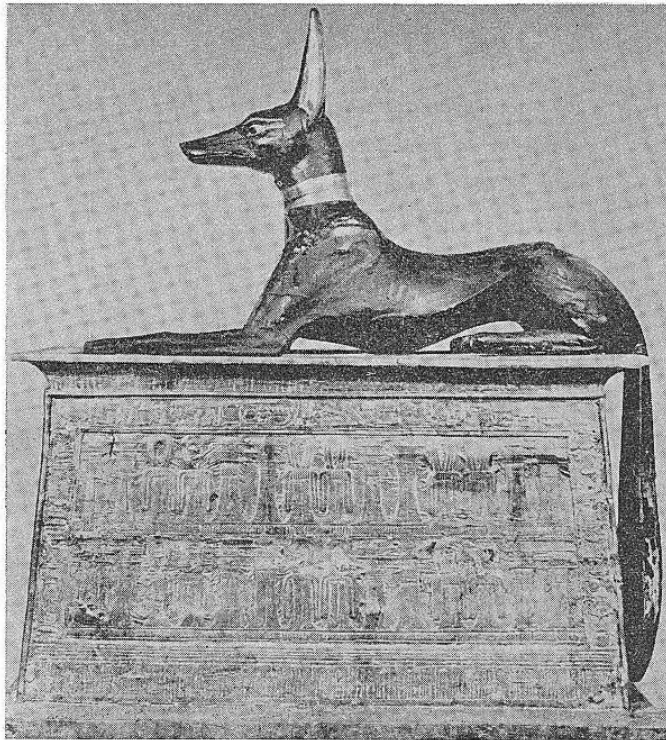
»u ovom čuvarskom stavu budnosti, on evocira bdenje«.

Ova misao bila je antičkom svetu izražena simbolizmom luka i strele, kao celine projekcije. U jogičnim filosofijama, princip luka i strele spada u bazični domen inicijacije (koordinacije). Iz svesti, kao iz luka koji je zarobljena gravitacija, probija