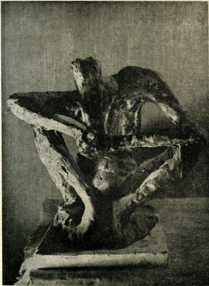
VLADETA PETRIĆ: PUŠAČ