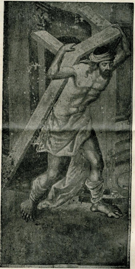
kopija iz krušedola

No, pored svega naša umetnost prve polovine XVIII veka, izgledalo je, kao da je uvek pažljivo osluškivala prorokanske Velsove reči — stvarnost je za nju zaista odavno bila srušena ali je ona produžavala svoj život pod primamljivim okriljem prošlosti — izražena u navodno zapadnom poreklu naše barokne umetnosti, sve do onog momenta kad će stvarna legenda roditi novu, svetliju stvarnost.