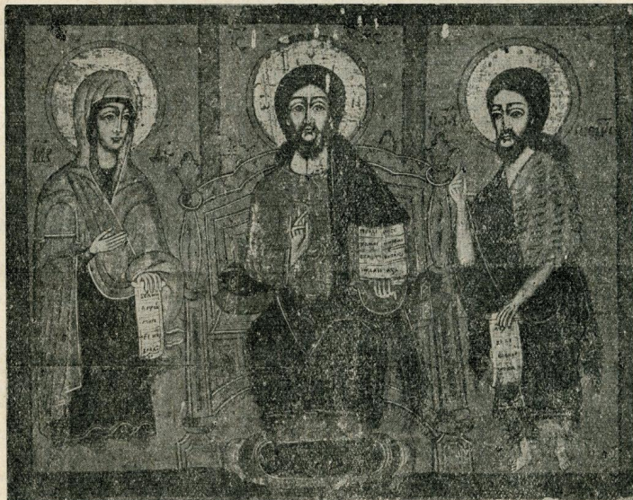
dvigs — XVIII v.