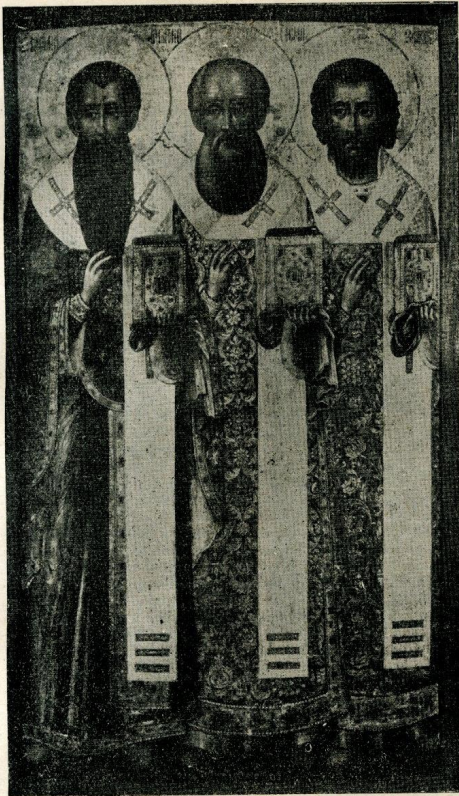
sv. tri jerarba