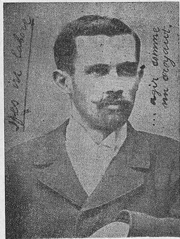
U GRADENJU LEGENDE O SKERLIĆU OZELI SU UCESCA APSOLUTNO SVI

On nije imao sluha za dijalektiku unutrašnje pesnikove radnice i rado je navodio Hajnovo odricanje sopstvene poezije u korist fišeka za gladne starice, a sav suptilni faustovski nemir i kočak pesnika sa neizrecivim, ne retko, svodio je na škrtost jedne građanski komotne formule o službi narodu. Skerlić nije slutio tamnije, dalekošniji ponornice stvaralačkih bića u kojima se kao u žiži ukrštaju perspektive narodnosti i bogatstva nasleđa, nije verovao da postoje plodne bolesti i verujuća odricanja, a sam pomen reči pesimizam,