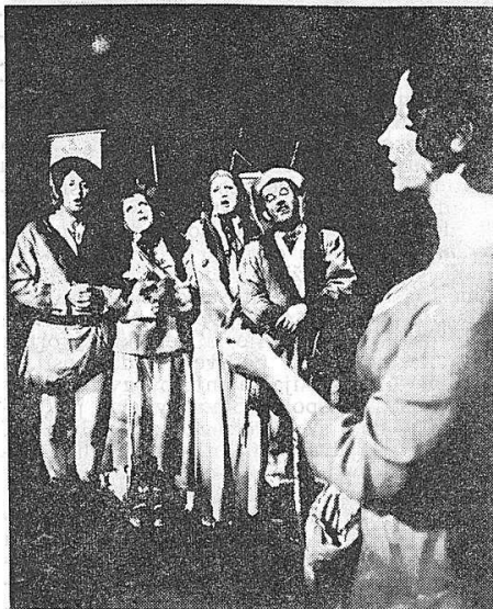
slovensko narodno gledališče, maribor a. hing: »lažna ivana«

Ako se Ilićevi motivi sabere, utvrdiće se da ih ima malo, svega nekoliko i da se pevanje koncentriše oko njih u kružnim zamascima. Ako ne želimo da to prebacimo pesniku, utvrdiće mo i pravi razlog te činjenice. Ilić vrednuje svet svog iskustva i doživljavanja, izvesne njegove strane odbacuje, ne da im da »probiju« u pesmu, tako da sam vrši aksiološko razvrstavanje svog iskustva odbacujući kao nepogodno za pesmu sve ono što ima pokoricu svakodnevnog, utilitarnog. To bi bio još jedan vid »čišćenja« u motivskom prostoru koji je strogo aksiološki zasnovan i učvršćen. Ilićeva pesma, postulirana u orfičkom prostoru, oslobođena je svega što bi se moglo shvatiti kao spoljne, kao nešto što bi gušilo poetsko razgranavanje u izabranom prostoru, što bi ga opterećivalo aksiološki manje značajnim momentima, pa bi i bukvalno razvlačilo strukturu pesme i njome pokrivalo