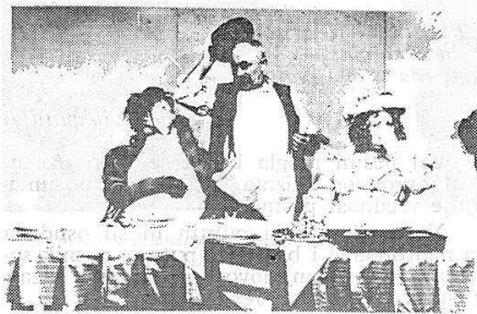
srpsko narodno pozorište, novi sad j. sterija popović: »pokondirena tikva«

manje vredne ili beznačajne detalje. Zato je Ilićeva pesma »otklonila« sve redundantno i zanemarljivo i ostvarila se u autentičnom prostoru, pa zato ona ne »luta« ni kao celina niti kojim posebnim stihom tražeći za šta da se semantički veže, već je u strogosti svog uobličavanja uvek okrenuta svom semantičkom središtu, ostvarujući svoje semantičko jezgro punim saglasjem svih elemenata. Zato se, mislim, može govoriti o ravnoteži u strukturi ovih pesama. Skoro sve pesme u Ilićevoj knjizi jesu u izvesnom tonskom saglasju, nijedna se oštro ne izdvaja svojim zvukom. Svaka pesma ima ton realizovan na semantičkom planu i na planu ritmičkih vrednosti, tako da je, prožeta elementima iste tonske vrednosti, mogla ove kasnije da preobratu u »atmosfera« koja se ne vezuje ni za jedan element pesme.