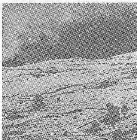
Zmago Jeraj »***«

da se približavam sebi najbolji znak je kada za sobom zatvorim sva vrata staklena i ona od olova tada mogu mirno sedeti i jedna tajna vrata bez moje i bez ičije pomoći znači sama od sebe otvoriće se niko to neće ni čuti ni videti iako su to sasvim izvesna vrata kao vrata muzeja ekspozatni se ni rukom ni okom ne mogu taći iza tih vrata samo mogu da se približavam sebi ako hoću