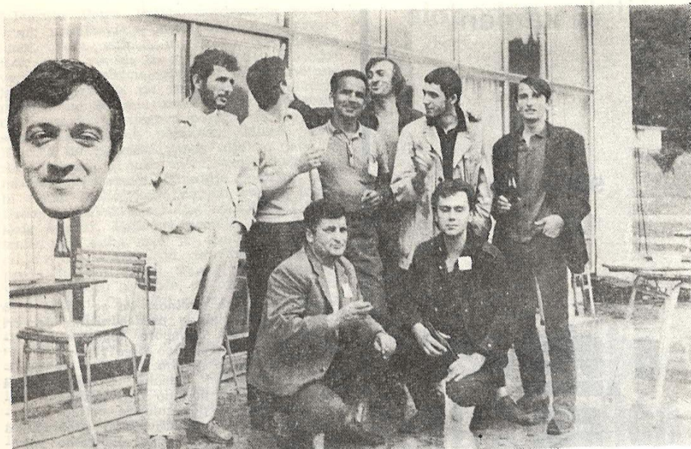
NOVOSADSKA EKIPA „MLADOST SUTJESKE 69”

Tjentište je u vremenu od drugoga do devetoga jula bilo domaćin susreta „Mladost Sutjeske 69” na kome je učestvovalo tri stotine mladih pesnika, slikara i recitatora iz četrdeset jugoslovenskih gradova.