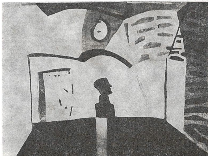
vladimir popin — akvatinta, 1970.

Povest o Župančičevoj temi pesništva trebalo bi nastaviti raščlanjivanjem pojedinačnih misaonih delova i lirskih osnova. Takvo bi raščlanjivanje otkrilo da je u ovoj temi pesništva uspostavljen kontinuitet s pesničkom tradicijom koja obuhvata renesansne, romantične i neoromantične izvore. Na saznavnom bi se nivou istraživanje moralo započeti od Platona i završiti u estetici simbolizma. Za probleme ove vrste prvenstveno je važno