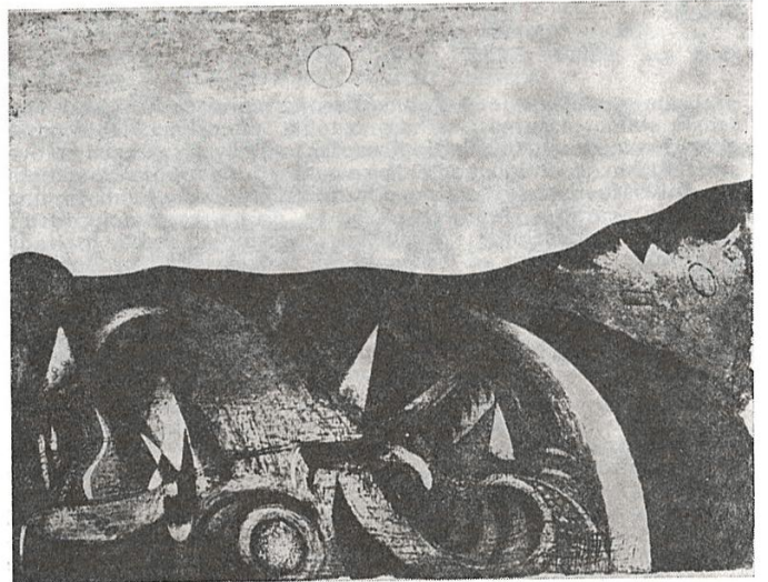
halila tikveša — akvatinta, 1961.