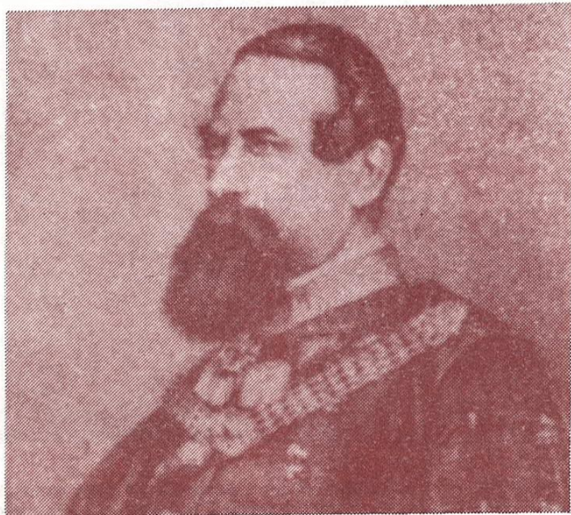
Jovan subotić sterija popović

Pominjao se Sterijin pesimizam i tražena je veza između Sterije i Edvarda Janga, pisca »Noćnih misli«. Dragiša Živković je u »Spomen putovanjima po doljnim predelima Dunava« našao izvesne »grobljanske motive«: »U prsima svak truleža usev nosi. (Zalud lekova ced protiv otrova bolesti raznih.) Sudba je čoveka ta: zemlja da zemlja bude«, »Vreme je satrlo sve, i ljude i Herkula samog«, »Vreme je satrlo sve, i delo i majstora samog«. I ovaj stih kao da pomera iz korena više puta pominjan Sterijin poslednji stih. (Te »grobljanske motive« mogli bismo naći i u Subotićevoj pesmi »Teodoru