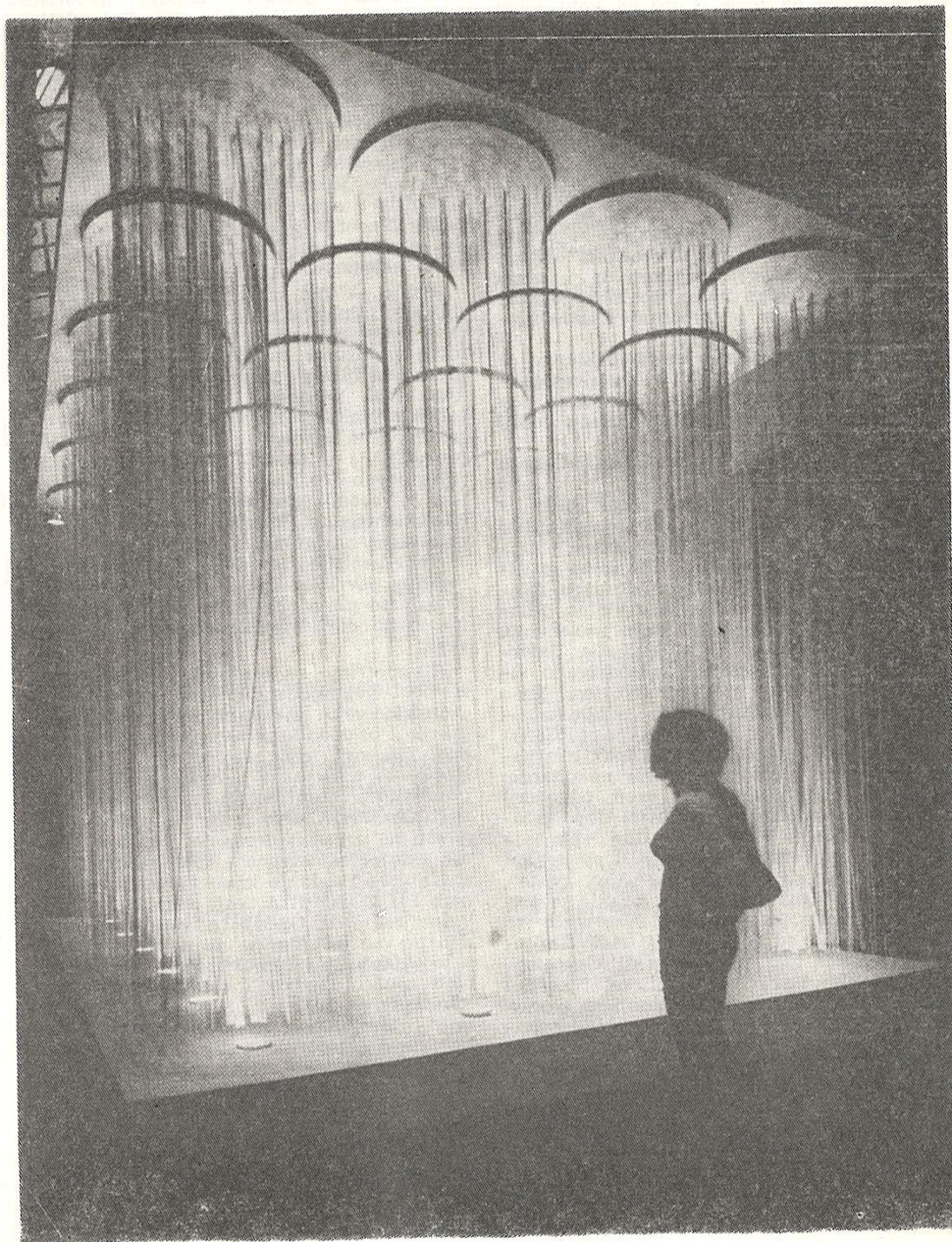
zasićenost pokreta, soto

Trenutno još nije nužno raspraviti tačno šta razume Aristotel pod ENÉRGEIA i koliko daje odrediti OUSÍA po ENÉRGEIA. Važno je paziti samo kako Aristotel ograničava filosofiju u njenoj biti. U prvoj knjizi METAFIZIKE (Met. A2, 982b 9sq) on kaže sledeće: Filosofija je EPÍSTĒME TON PRÓTON ARHON KAÍ AITION THEORETIKĒ. Rado se EPÍSTĒME prevodi „nauka“. To je skretanje ukrivo, jer tako olako puštamo da utekne moderna predstava „nauke“. Prevodenje EPÍSTĒME sa „nauka“ pogrešno je i onda ako „nauku“ razumemo u filosofskom smislu, kojim su je mislili Fichte, Schelling i Hegel. Reč EPÍSTĒME izvodi se iz participa EPÍSTĀMENOS. Tako se zove čovek ukoliko je za nešto nadležan i umešan (nadležnost u smislu appartenance). Filosofija je EPÍSTĒME TIS, neka vrsta nadležnosti, THEORETIKĒ, koja osposobljava to THEORĒIN, tj. izgledati na nešto i to, za čim se izgleda, gledati i održavati u pogledu. Filosofija je stoga EPÍSTĒME THEORETIKĒ.