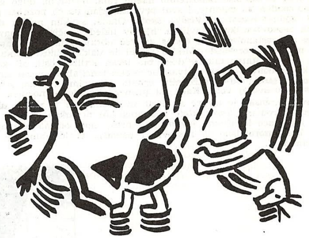
crtež v. i d. burljuk — iz knjige tvorenija , 1914,

Kada sam oko podne stigao u grad, već su bili doneli odluku u tremu Velikog hrama. Mladog sledbenika uhapsili su u devet sati ujutru špijuni A. u jednom od unutrašnjih dvorišta hrama. Rabin Abjatar je prilikom hapšenja bio prisutan samo kao pozvani svedok; jednog poručnika su bili poslali po njega. Kažu, najpre se ustezao i pozivao se na staro običajno pravo po kome kao pozvani svedok može svedočiti s punom važnošću samo onaj ko je obredno pranje ruku obavio još pre nego što je pop pozvan. Najzad se ipak prihvatio svedočenja, ali u odluku se nije mešao. Kada je Rabi Abjatar stigao, Stefana — tako se zvao sledbenik — već je okruživala gomila od stotinak ljudi. Ali mnogi ni tada još nisu verovali da će se dogoditi ono što je potom usledilo. Pre su računali sa saslušavanjem, prodornim, ubojitim pitanjima, što je spadalo u unapred smišljeno iznuriavanje. Ispostavilo se, međutim, da ovoga puta očekuju neopoziv odgovor. Dva špijuna su već na početku rasprave s dve strane pritesnili Stefana kraj jednog visokog zida do kojeg su vodile stepenice; čitavo vreme nisu progovorili ni reč. Njihov se posao sastojao u tome da uporno motre sledbenika, po mogućnosti nepomična lica, s desna i s leva, a da ni u slučaju najžešće prepirke i vike ne menjaju svoje držanje. Svetina se razmestila po stepenicama, Rabin Abjatar na najvišem stepeniku, s kraja, po-