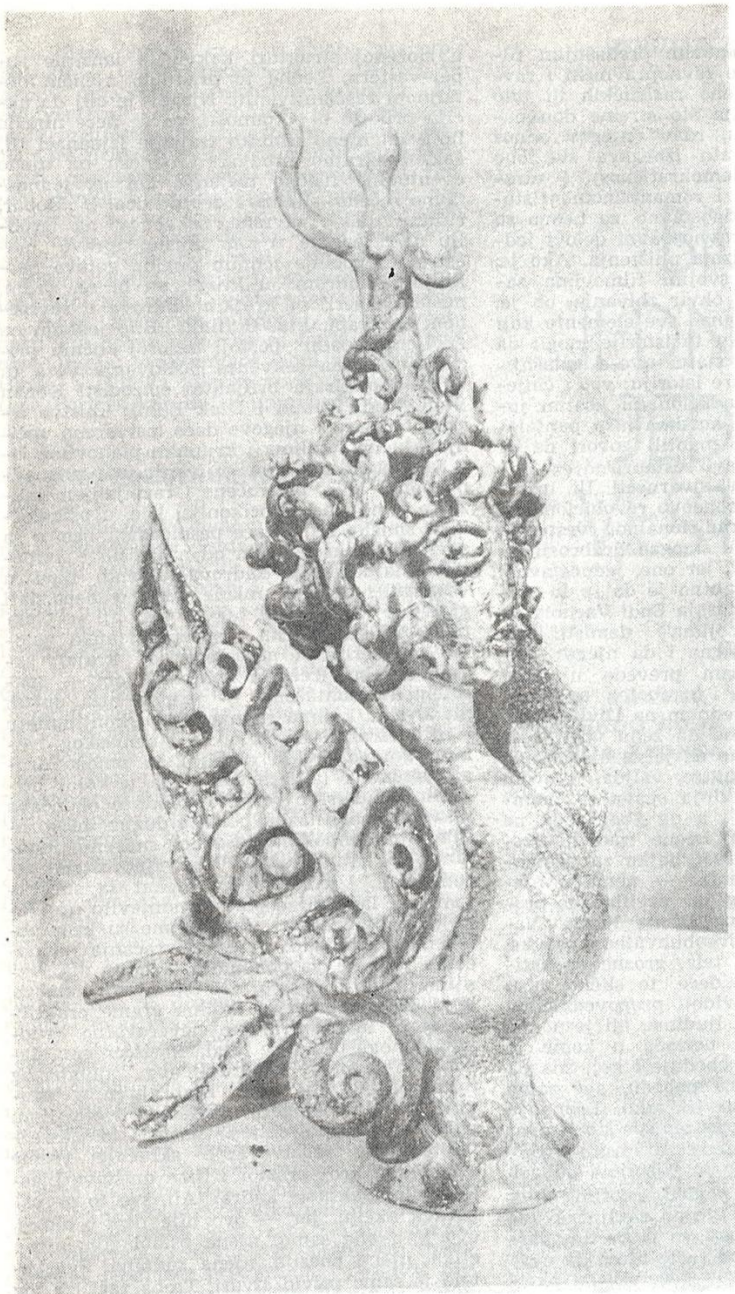
Adžić Dragoljub: METAMORFOZA POETE — keramoplastika