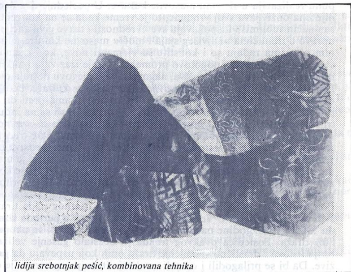
lidija srebotnjak pešić, kombinovana tehnika

U tom intenzivnom procesu sazrevanja socijalističke revolucije KPJ je izrasla u partiju masa i partiju revolucije. Takvom njenom rastu u drugoj polovini 40.-tih godina najviše je doprineo njen generalni sekretar Tito. Da njega nije bilo tada i kasnije na čelu Partije tokovi naše najnovije istorije, neosporno je, pošli bi drugim putem i naša zemlja danas ne bi bila ono što jeste. Otuda je Tito postao sinonim naše Partije i revolucije, svih naših pobeda i dostignuća i jedna od najistaknutijih istorijskih ličnosti dvadesetog veka.