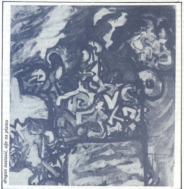
dragan nastasić, ulje na platnu