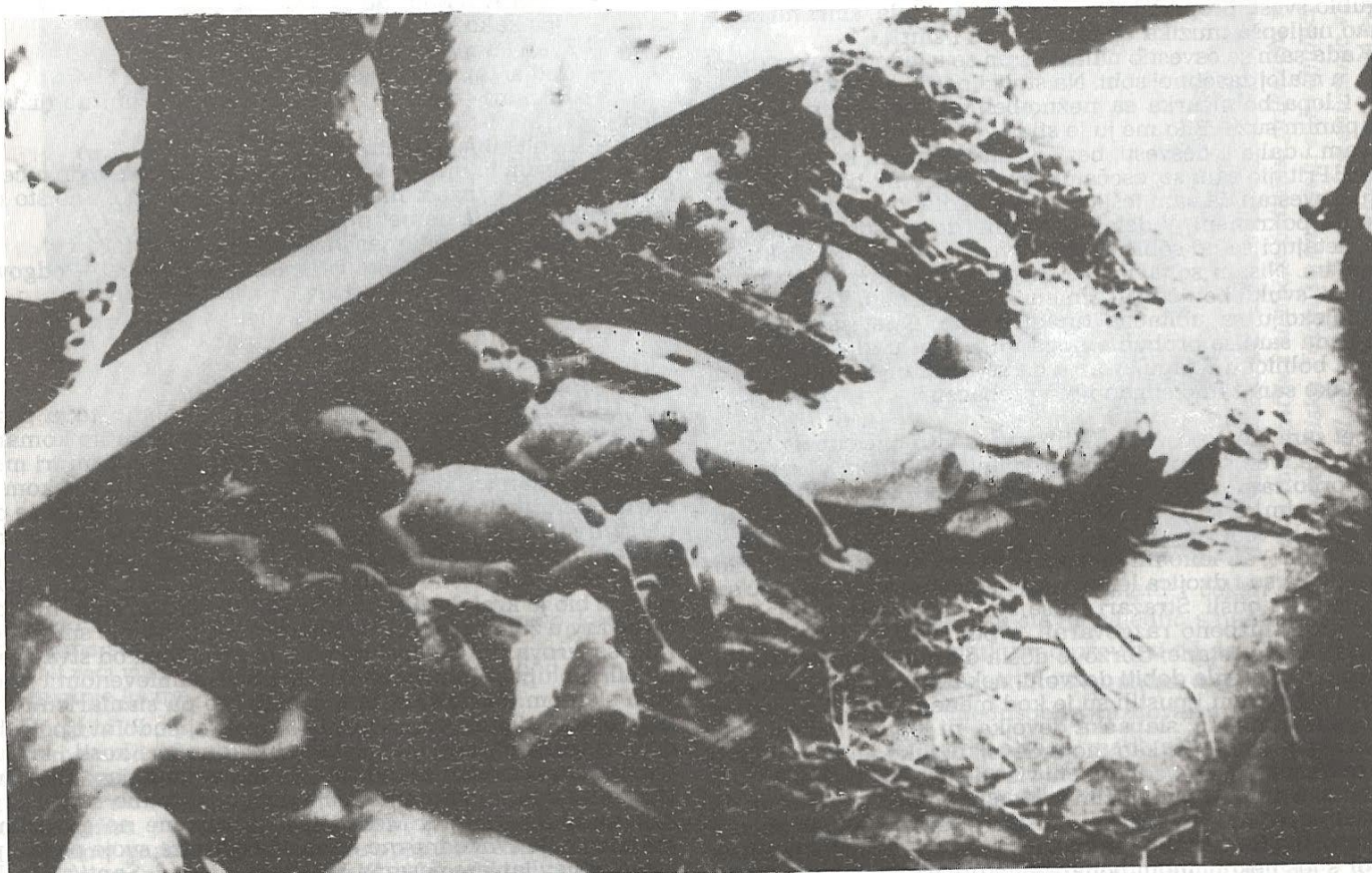
Solana »Reis« u Sisku pretvorena je u mrtvačnicu malih logoraša. . .

— Zapamti ime moje sestre. Odesi joj pozdrav. Stanujem u staroj vili u zabačenom i šumovitom delu Dedinja. Okolina zna o meni, jer sam dugo radio kao lekar. Lako ćeš naći moju sestru.