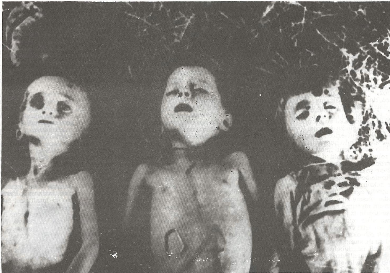
Iz logora u Sisku...