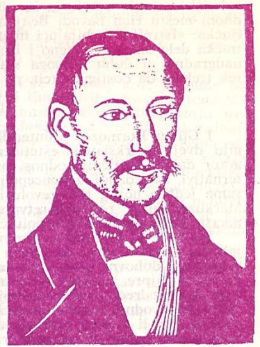
nebojša radojev: sterija (crtež)