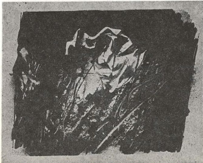
gorazd šafjan: sindon IX, 1981, litografija

Lewis Alban & William Groman, »Dreamwork in a Gestalt Therapy Context«, u: »The American Journal of Psychoanalysis«, Vol XXXV, No 2, Summer, 1975. Iz teksta su prevedeni samo oni odeljci koji se direktno odnose na gestaltističku teoriju sna. Obimniji deo originala, koji se odnosi na gestaltističku tehnologiju rada na snu, ovde nije preveden. (Prim. prev.)