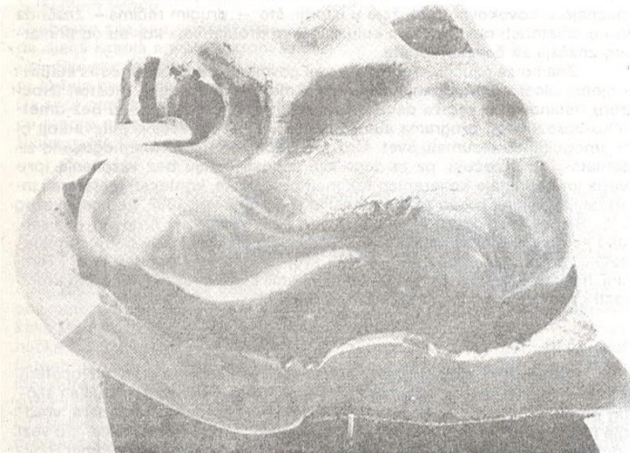
likovni prilozi na str 110, 131, 137, 145 i 154; mladen marinček

Ovo razmišljanje se ovim približilo području koje nazivamo individualnim razlozima neefikasnosti kritike u kulturi. Mi Slovenci smo premlalo razmišljali o tome kakve su nam perspektive otvorile tradicija seljačkih buna i iskustva narodnoslobodilačke borbe. Naš duhovni prostor je skoro uvek bio podeljen na dobre Janeze i rdave Mihe, zbog čega još i danas ima recidiva ideologiziranja tamo gde bi bilo potrebno samo humaniziranje. Umesto