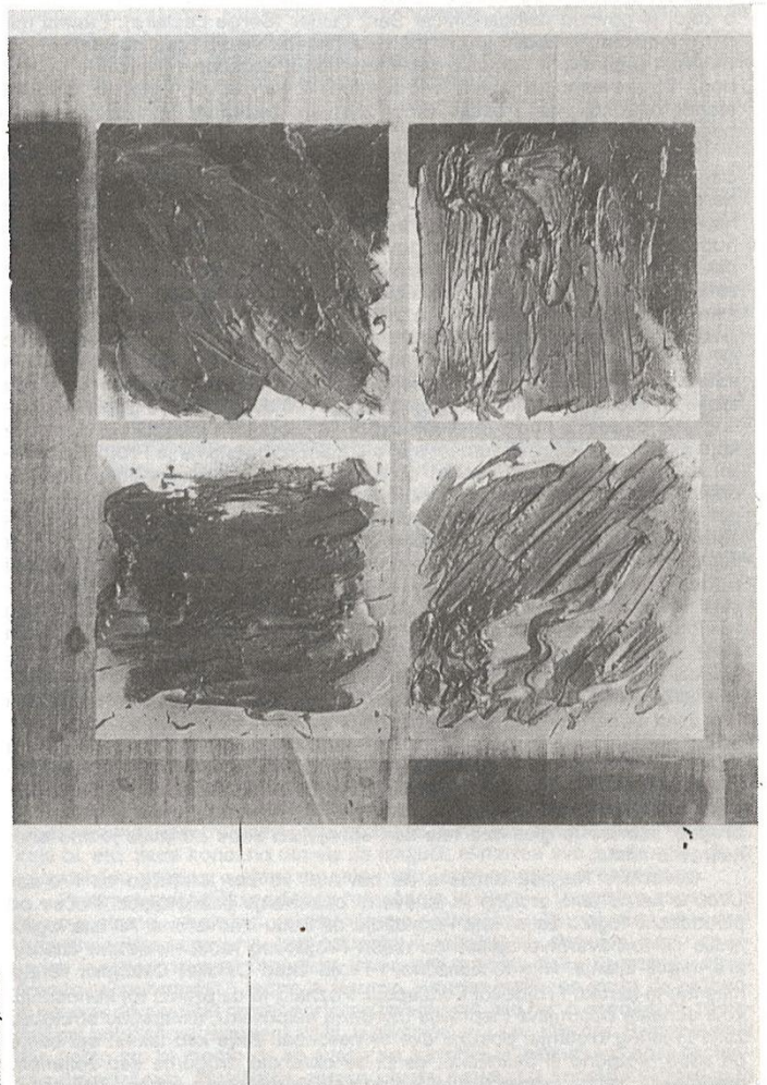
mihail kiralj, crtež