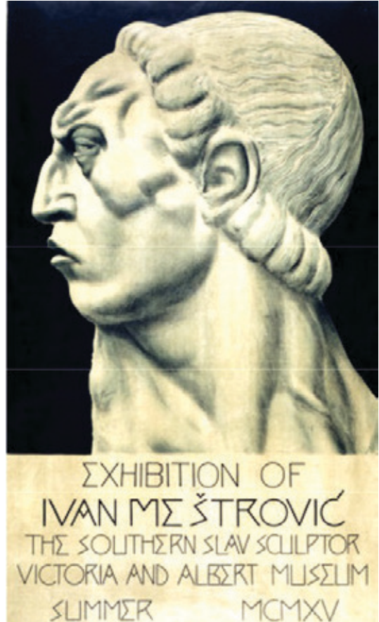
Plakat za izložbu Meštrovićevih dela, 1915.

Ovim pitanjima on se vraćao i u kasnijim tekstovima i proglasima.